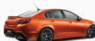
Les voitures ont 5 sièges

Quelles sont les trois combinaisons qui peuvent être utilisées pour que les trois classes puissent faire leur sortie éducative?