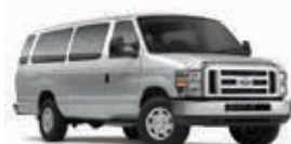
Les minibus ont 16 sièges