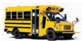
Les bus ont 20 sièges