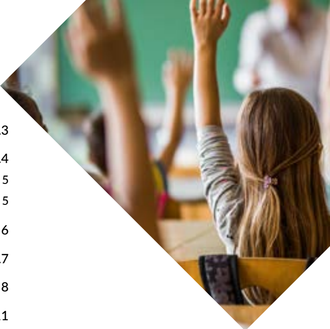
Tabla of Contenido