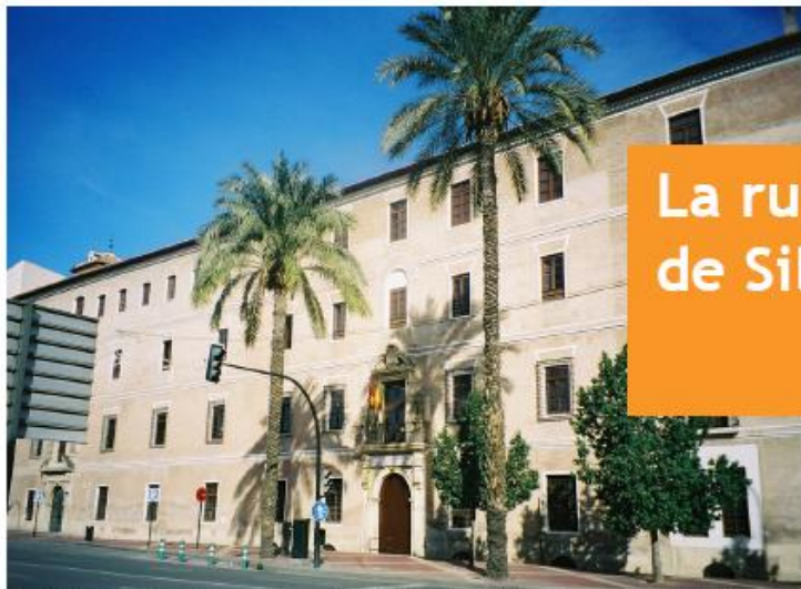
Instituto de Enseñanza Secundaria "Licenciado Francisco Cascales" Murcia

AUTOR: Martín Moseley y Silvia Guajardo Aragüés S. Peter's Collegiate School, Wolverhampton