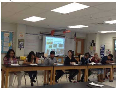
Reunión del Ayuntamiento y mesa redonda

La unidad entera obligó a los estudiantes pensar a altos niveles, relacionar contenido científico con aplicaciones del mundo real y permite a los estudiantes la oportunidad de dialogar entre ellos sobre el contenido de la ciencia.