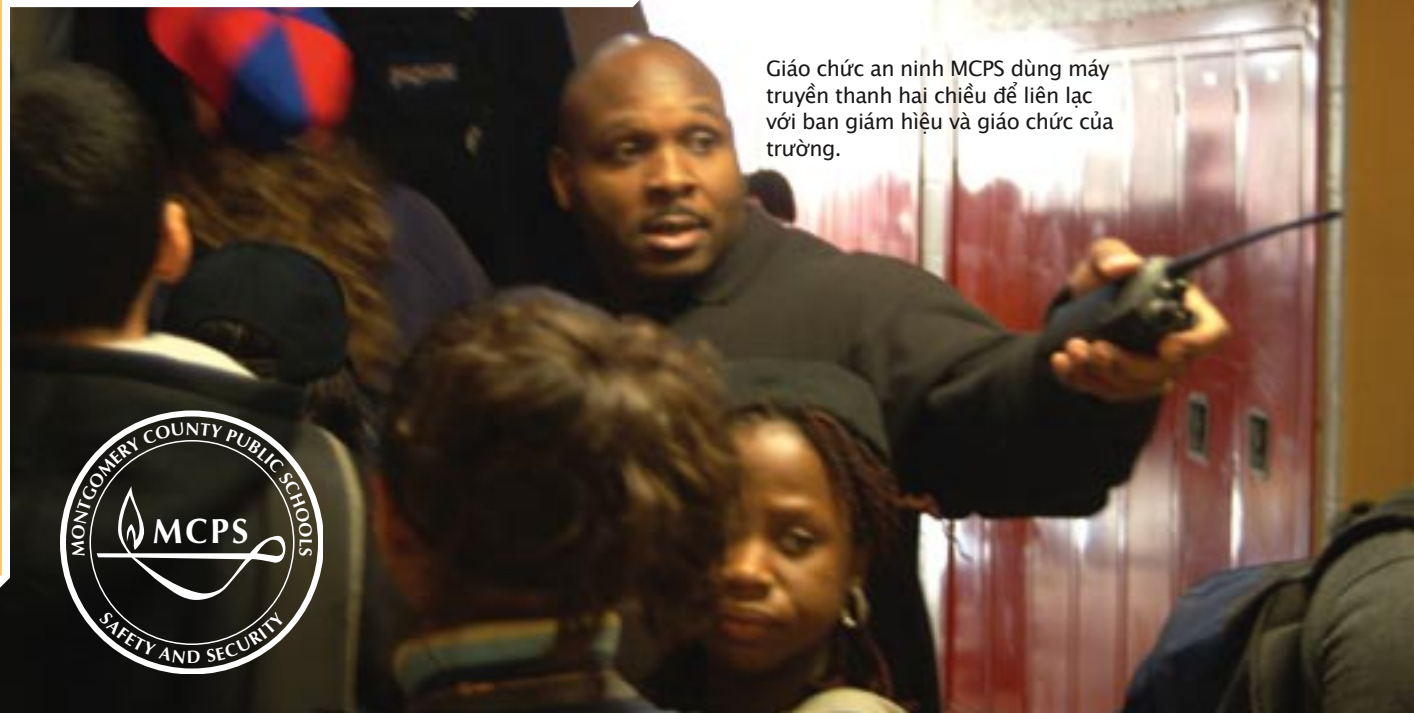
Giáo chức an ninh MCPS dùng máy truyền thanh hai chiều để liên lạc với ban giám hiệu và giáo chức của trường.

Việc phụ huynh gặp lại con em (PCR) là phương thức được Montgomery County Public Schools áp dụng để giúp nhà trường giao trả học sinh lại cho phụ huynh hay giám hộ sau các trường hợp khẩn cấp/ khung hoảng. Phương thức này giúp việc giao trả học sinh cho phụ huynh được diễn ra trong trật tự. Các phụ huynh và giám hộ cần mang theo thẻ căn cước để giúp nhà trường trong phương thức này. Nếu không thể trực tiếp đón con, phụ huynh hay giám hộ có thể chỉ định người đón con mình trong các trường hợp khẩn cấp/ khung hoảng. Các phụ huynh và giám hộ cũng được khuyến khích tham khảo với nhà trường để biết rõ về kế hoạch trong các trường hợp khẩn cấp/khung hoảng, gồm cả phương thức PCR.