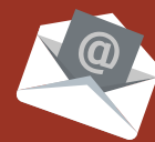
How to Schedule

Bus open for scheduling from March - November every year.