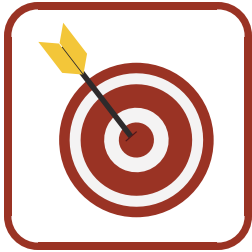
Pick a Location