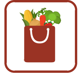
Host a Pop-Up Pantry